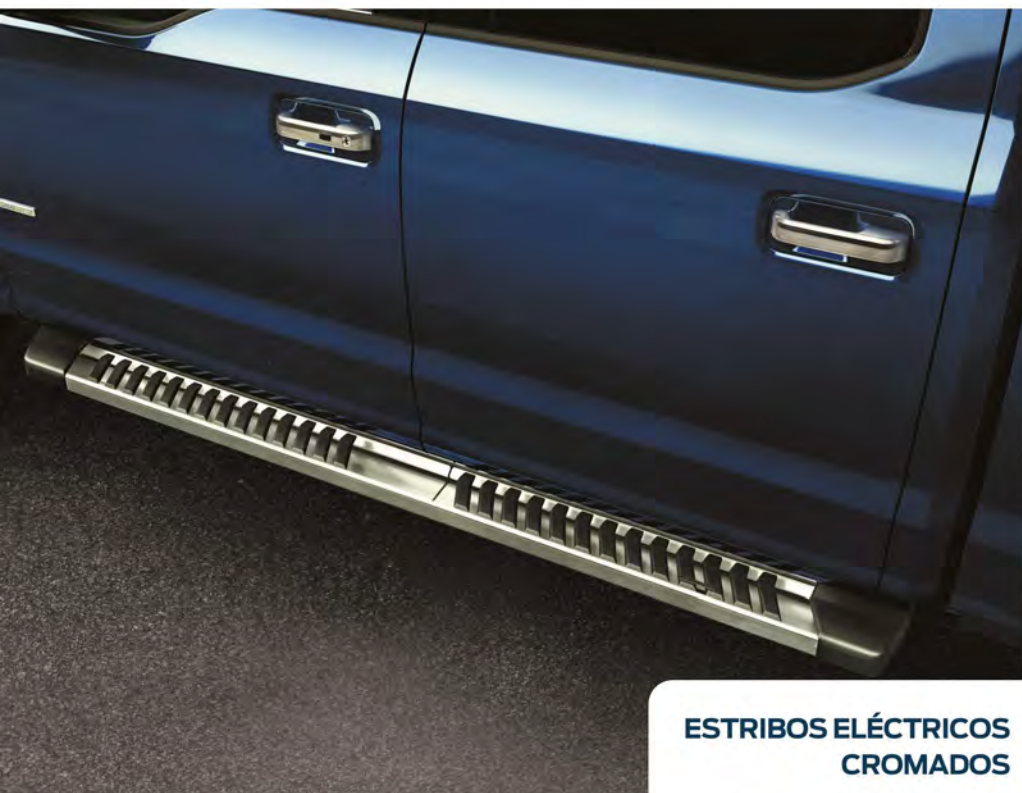
ESTRIBOS ELÉCTRICOS CROMADOS