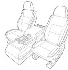
Asientos delanteros con consola central LOBO LARIAT LOBO PLATINUM

En cuanto al interior, la construcción y diseño de la cabina es ahora mucho más inteligente y amplia, con un innovador diseño en el panel de instrumentos y la consola central. El espacio para piernas en el frente aumentó un 6% y el espacio para caderas un 3%, ofreciendo mayor comodidad.