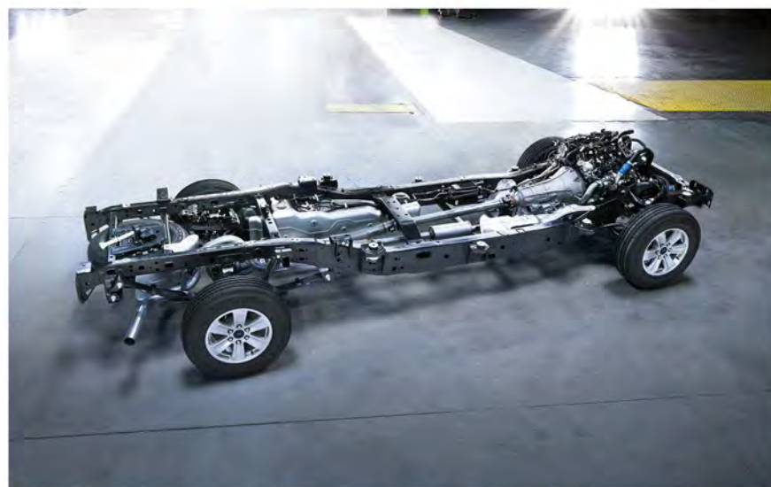
CHASIS CON 78% DE ACERO DE ALTA RESISTENCIA

Remachado avanzado y adhesivos resistentes que crean una unión continua de múltiples componentes para actuar como una sola estructura sólida.