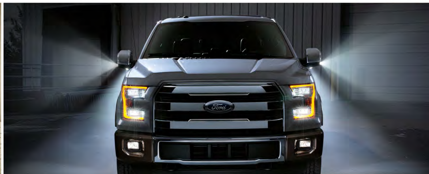
ILUMINACIÓN LATERAL CON LUCES LED (ÚNICA EN SU CLASE)