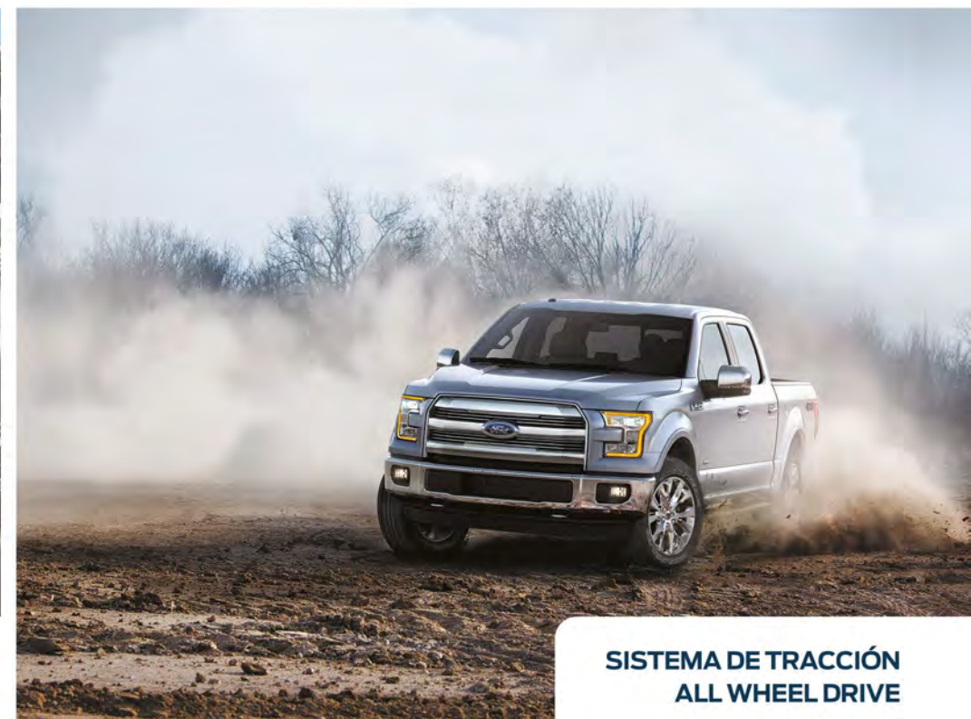
SISTEMA DE TRACCIÓN ALL WHEEL DRIVE