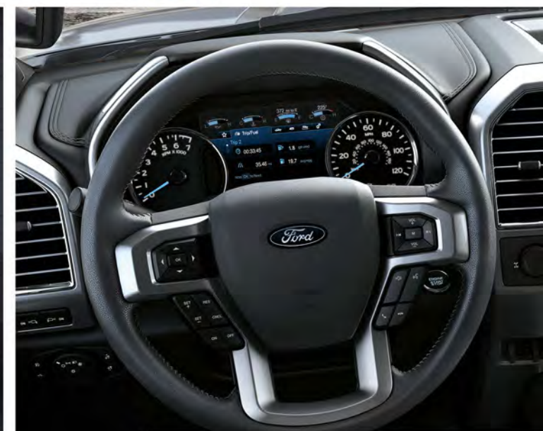
VOLANTE FORRADO EN PIEL CON CONTROL DE ENTRETENIMIENTO