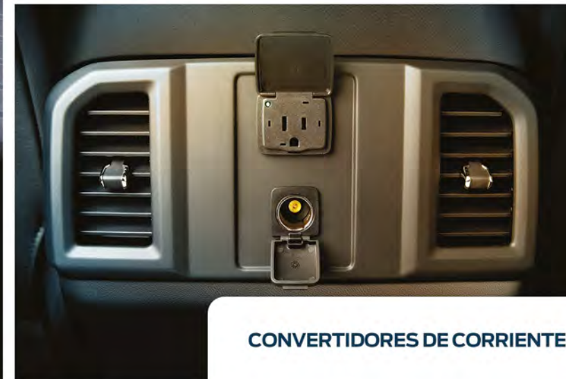
CONVERTIDORES DE CORRIENTE