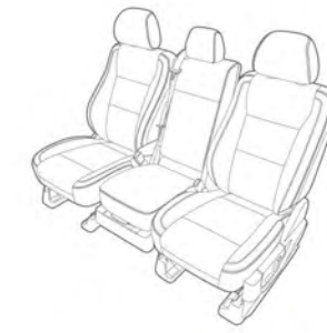
Asientos delanteros tipo banca LOBO XLT