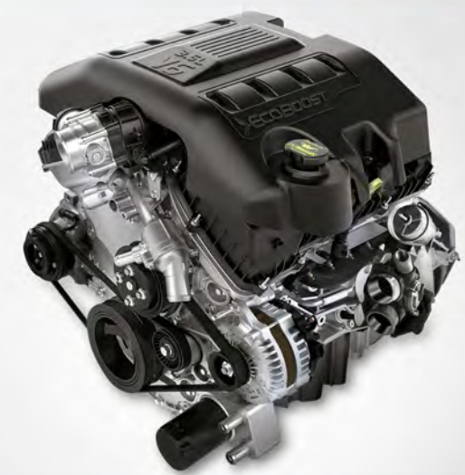
EL MOTOR ECOBOOST® ES EFICIENTE, ÁGIL, POTENTE Y CON UN GRAN TORQUE (365 HP Y 420 LB.PIE)