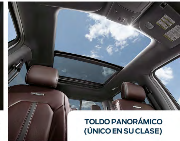
TOLDO PANORÁMICO (ÚNICO EN SU CLASE)