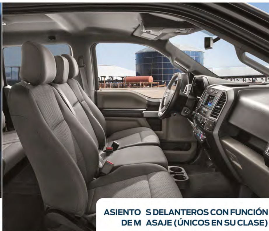
ASIENTOS DELANTEROS CON FUNCIÓN DE MASAJE (ÚNICOS EN SU CLASE)